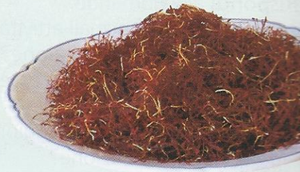
Pistilli di zafferano. ▼

La cucina dell'Abruzzo ha sapori forti e decisi. Uno degli ingredienti tipici è lo zafferano , coltivato in particolare nella zona di Avezzano. Lo si adopera anche per condire la pasta: si prepara un soffritto con la pancetta, poi si unisce la ricotta di pecora e lo zafferano disciolto in acqua.